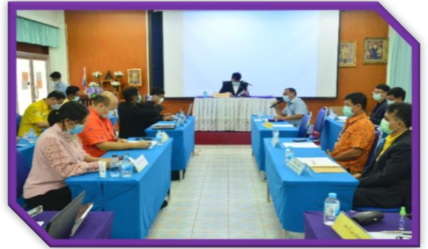
สสม.ภาคใต้ สสม.ชายแดนใต้ สบส.๑๑ และ สบส.๑๒ ร่วมเป็นเจ้าภาพ ในการจัดงาน