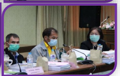
ภาคีเครือข่ายจาก ศูนย์วิชาการระดับเขต ชมรม อสม. และ อสม.ดีเด่นระดับชาติ เข้าร่วมเป็นคณะกรรมการฯ