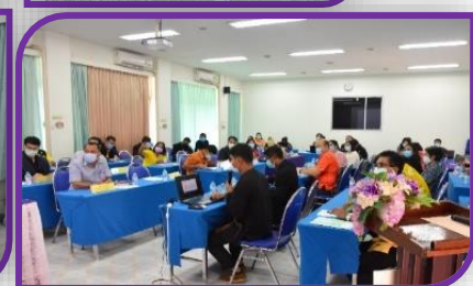
มาตรการการป้องกันโรค COVID-๑๙