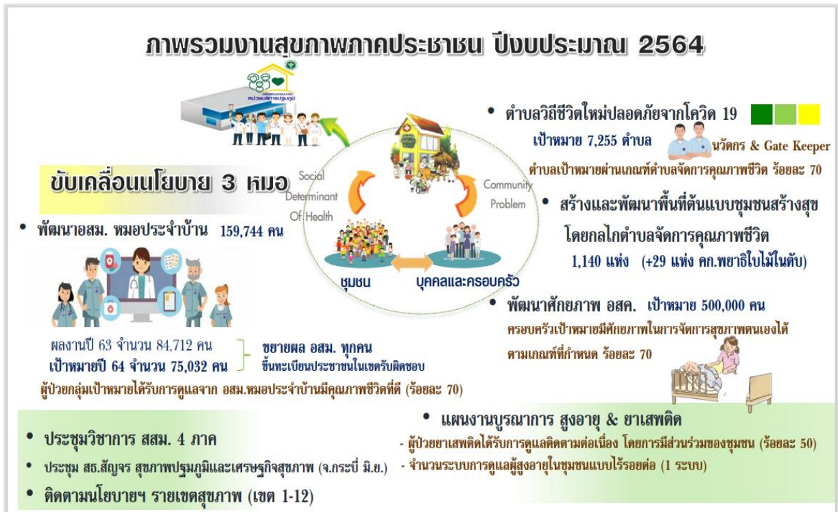
ภาพที่ ๓ ภาพรวมงานสุขภาพภาคประชาชน ปีงบประมาณ ๒๕๖๔

ในปีงบประมาณ พ.ศ. ๒๕๖๔ ศูนย์พัฒนาการสาธารณสุขมูลฐาน ได้รับการถ่ายทอดภารกิจและงบประมาณสนับสนุนการดำเนินงาน จากกองสุขภาพภาคประชาชนเพื่อขับเคลื่อนการดำเนินงานตามเป้าหมายดังนี้