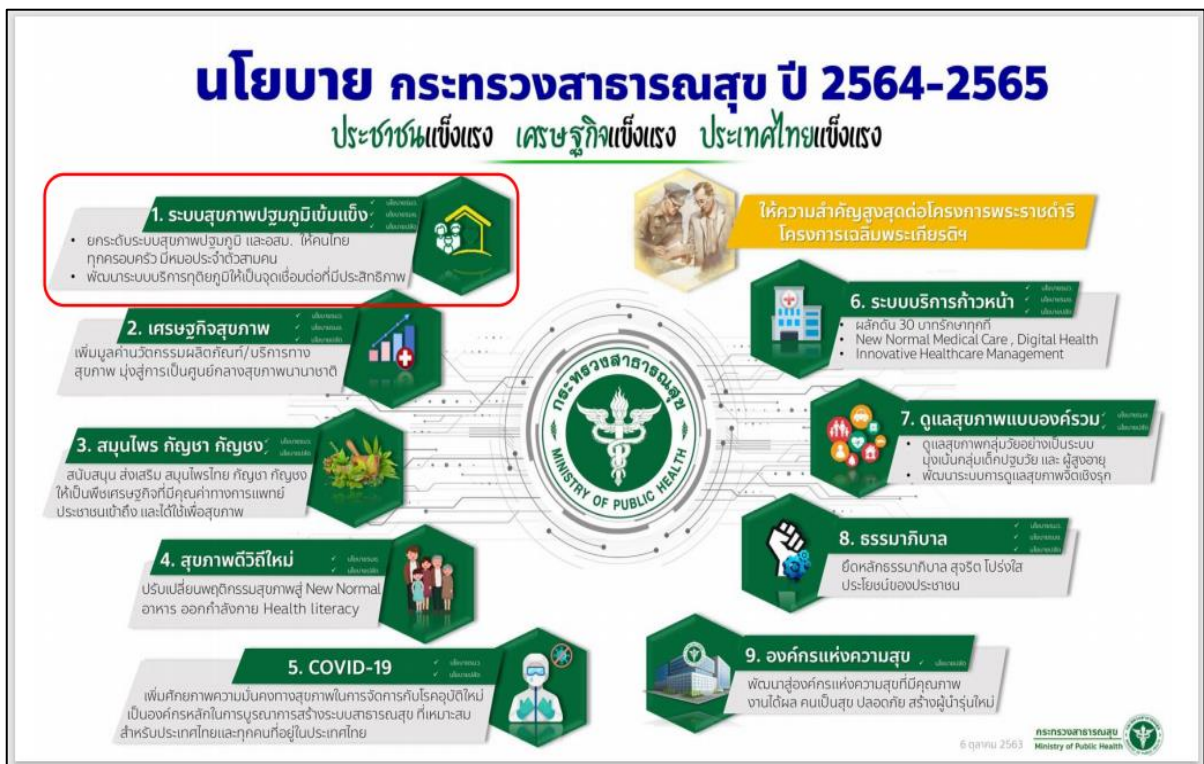
ภาพที่ ๒ นโยบายของกระทรวงสาธารณสุข ปี ๒๕๖๔ - ๒๕๖๕

แผนงาน โครงการ และตัวชี้วัด ของกองสนับสนุนสุขภาพภาคประชาชน ปีงบประมาณ ๒๕๖๔ ประกอบด้วย ๓ แผนงาน ๑๒ โครงการ ได้แก่ ยุทธศาสตร์ที่ ๑ พัฒนาเครือข่ายกำลังคนให้มีความรู้ เข้าถึงข้อมูล ตัดสินใจและปฏิบัติได้ ประกอบด้วย ๔ โครงการ ได้แก่ โครงการยกระดับ อสม.หมอบริการบ้าน เพื่อขับเคลื่อนนโยบาย ๓ หมอ สนับสนุนการพัฒนาอาสาสมัครครอบครัว (อศค.) การส่งเสริมความเป็นเลิศและเสริมสร้างแรงจูงใจในการจัดการสุขภาพชุมชนของ อสม. โดยการคัดเลือก อสม.ดีเด่น และจัดงานวัน อสม. ยุทธศาสตร์ที่ ๒ พัฒนาระบบสุขภาพชุมชนเชื่อมโยงเครือข่ายปฐมภูมิ (พขอ./PCC) ประกอบด้วย ๕ โครงการ ได้แก่ โครงการตำบลจัดการคุณภาพชีวิต ที่ครอบคลุมประเด็นงานสุขภาพทุกกลุ่มวัยในระดับตำบล และพัฒนาการสนับสนุน NGOs (งบอุดหนุน) ยุทธศาสตร์ที่ ๓ พัฒนาระบบบริการ และนวัตกรรมสาธารณสุขมูลฐานและสุขภาพภาคประชาชน ได้แก่ โครงการส่งเสริมกระบวนการเรียนรู้ด้านวิชาการและนวัตกรรมผ่านวารสาร สข. และช่องทางต่าง ๆ และ ยุทธศาสตร์ที่ ๔ พัฒนาระบบบริหารจัดการงานสุขภาพภาคประชาชนด้วยเทคโนโลยีดิจิทัล ได้แก่ โครงการพัฒนาและขับเคลื่อนยุทธศาสตร์สุขภาพภาคประชาชนสู่การปฏิบัติ และองค์กรแห่งความสุข