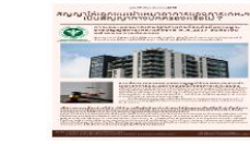
สัญญาให้เอกชนเข้ามาจัดการของกรมฯเป็นสัญญาทางปกครองหรือไม่?