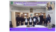
การไกล่เกลี่ยข้อพิพาท วันวันที่ 30 มกราคม 2569

เมื่อผู้รับจ้างก่อสร้างไม่ทำการก่อสร้างให้แล้วเสร็จตามสัญญาจนกระทั่งหน่วยงานทางปกครองผู้ว่าจ้างบอกเลิกสัญญา และได้มีการดำเนินการเพื่อหาผู้รับจ้างรายใหม่เข้าทำการก่อสร้างแทน จนเป็นเหตุให้ค่าแรงและค่าวัสดุเพิ่มขึ้น ผู้รับจ้างจะต้องรับผิดชอบค่าใช้จ่ายที่เพิ่มขึ้นแก่ผู้ว่าจ้างหรือไม่?