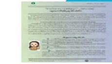
คำรับจากกรณีศึกษา