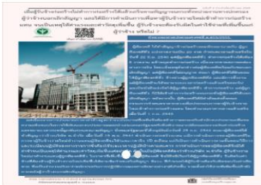
ข้าราชการพลเรือนสามัญระดับชำนาญการพิเศษต้นแบบ สุระและใช้ศักยภาพคนภายใต้กำกับเจ้าพนักงานที่ปฏิบัติงาน HM

เมื่อผู้รับจ้างก่อสร้างไม่ทำการก่อสร้างให้แล้วเสร็จตามสัญญาจนกระทั่งหน่วยงานทางปกครองผู้ว่าจ้างบอกเลิกสัญญา และได้มีการดำเนินการเพื่อหาผู้รับจ้างรายใหม่เข้าทำการก่อสร้างแทน จนเป็นเหตุให้ค่าแรงและค่าวัสดุเพิ่มขึ้น ผู้รับจ้างจะต้องรับผิดชอบค่าใช้จ่ายที่เพิ่มขึ้นแก่ผู้ว่าจ้างหรือไม่?