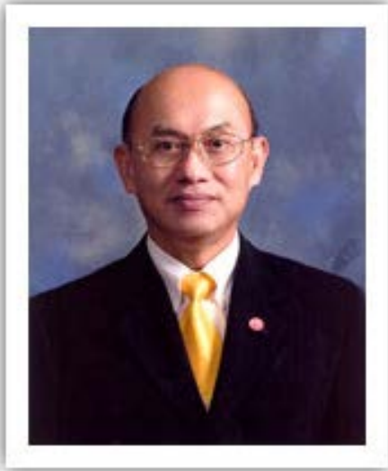
ศ.เกียรติ นพ.เกษม วัฒนชัย องคมนตรี