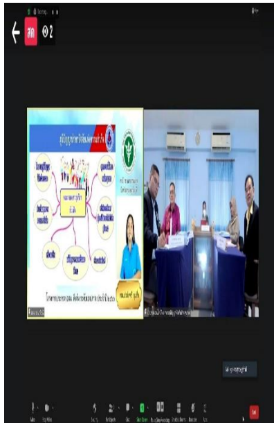
KM งานคัดเลือก อสม.ดีเด่น