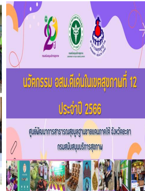
นวัตกรรม อสม.ดีเด่น เขตสุขภาพที่ 12 ปี 2566 ระดับเขตขึ้นไป