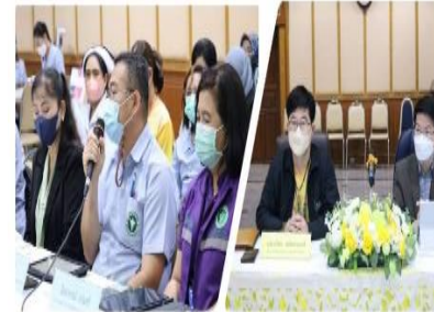
นิเทศงานในคณะกรรมการ ปฐมภูมิ