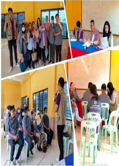
ทีมวิชาการเก็บข้อมูล อ.เบตง