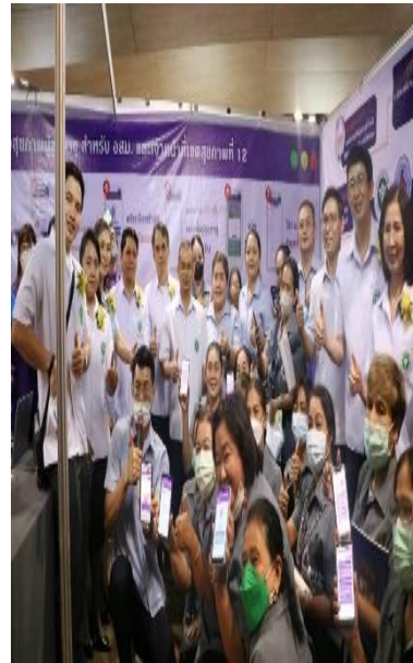
มหกรรม ผสอ.