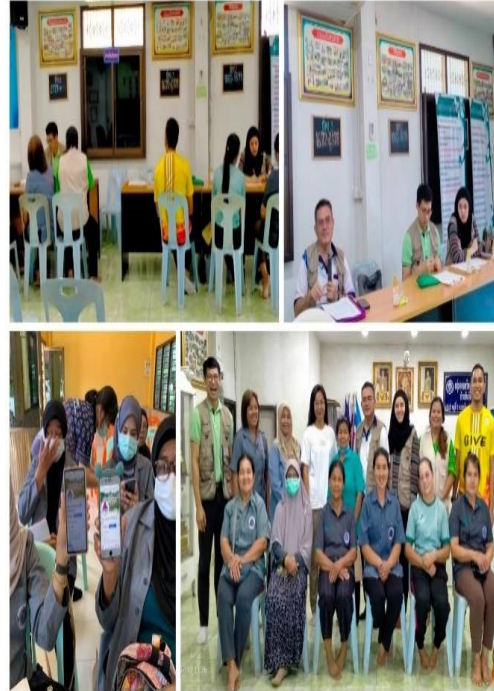
ทีมวิชาการเก็บข้อมูล อ.ธารโต