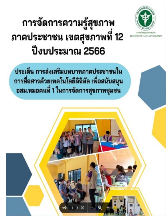
รูปเล่มการจัดการความรู้