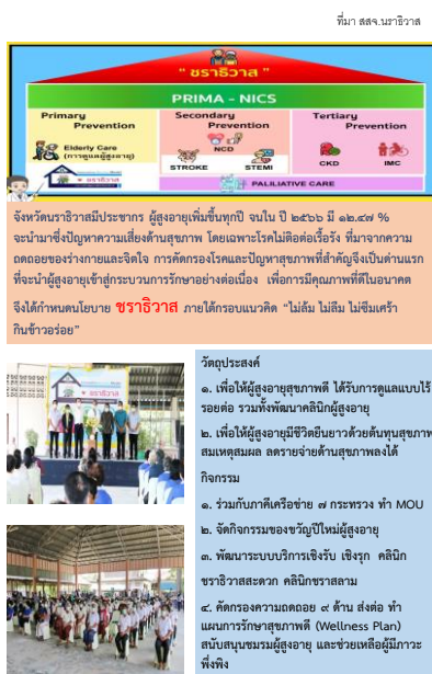
นวัตกรรมชราชีวา จากการตรวจราชการ รอบ 2 ปี 66 จ.นราธิวาส