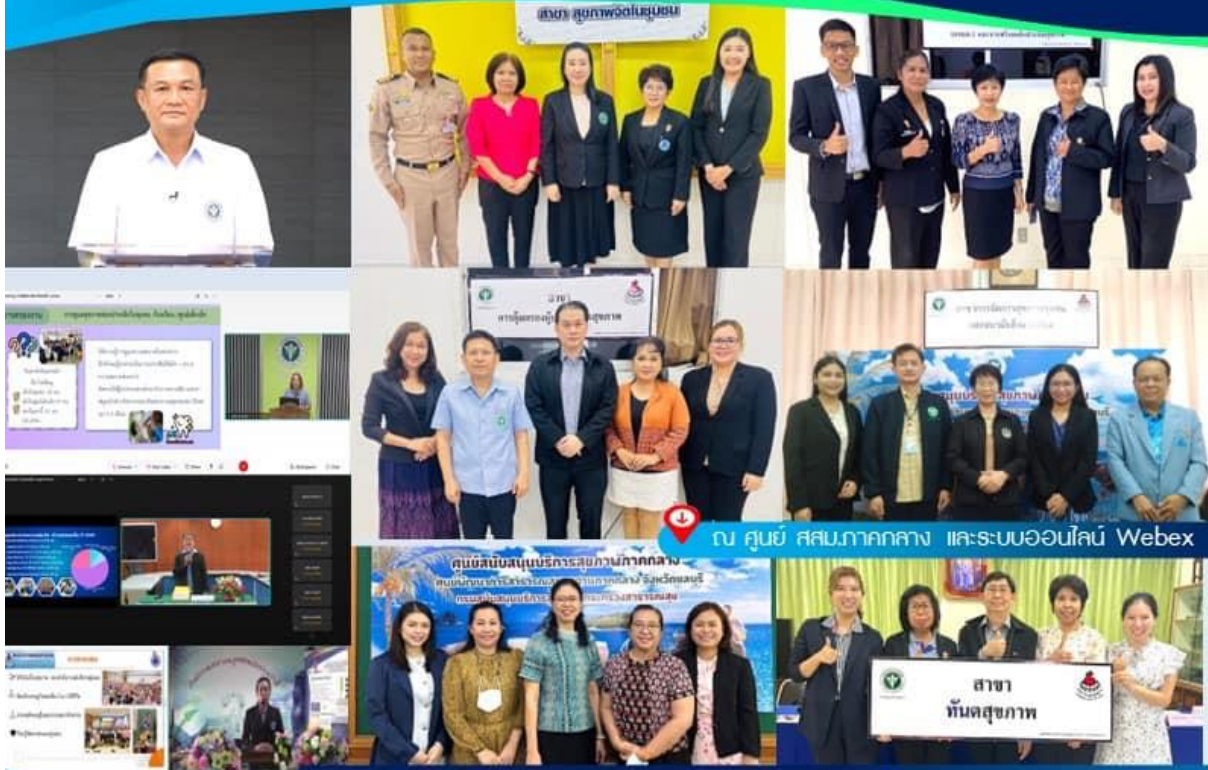
ณ ศูนย์ สสท.ภาคกลาง และระบบออนไลน์ Webex