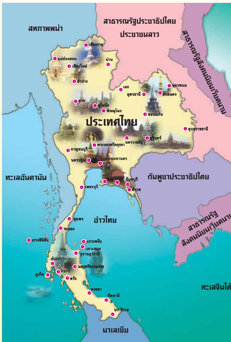
ภาพที่ 2.1 แผนที่ประเทศไทย

ประเทศไทยตั้งอยู่ในภาคพื้นทวีปเอเชียตะวันออกเฉียงใต้ (Continental Southeast Asia) เทียบบริเวณเส้นศูนย์สูตร โดยเป็นส่วนหนึ่งของคาบสมุทรอินโดจีน (ภาพที่ 2.1)